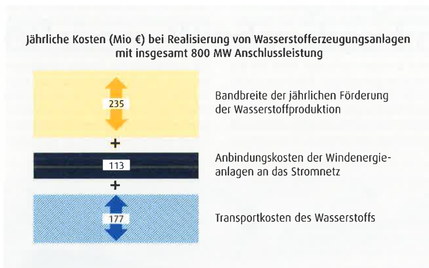
Bild 3. Jährliche Kosten

Best-Case-Szenario 910 €/kW, 6000 Volllaststunden, 52 kWh/kg(H 2 ), Kosten grauer Wasserstoff 7,2 €/kg Worst-Case-Szenario 1220 €/kW, 4000 Volllaststunden, 55 kWh/kg(H 2 ), Kosten grauer Wasserstoff 1,3 €/kg